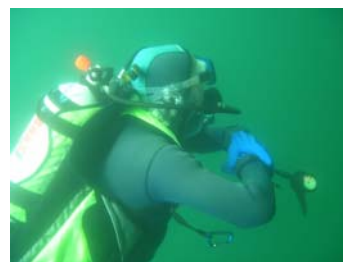
Süplingen, August 2007