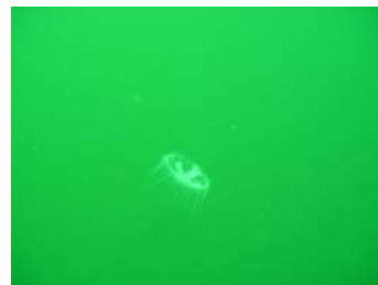
Süßwassermeduse, Süplingen August 07