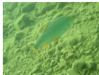
Süplingen, August 2007