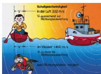
Ausbreitung des Schalls