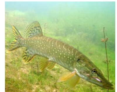
Hecht