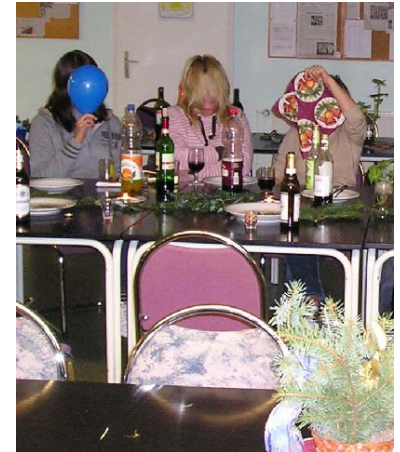
Kegelabend-Suchbild: who is who ??