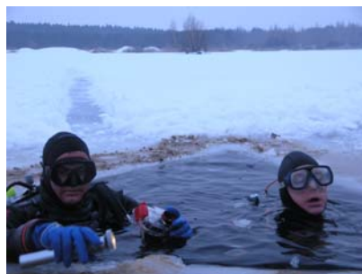
07.Februar - der Einstieg von „oben“