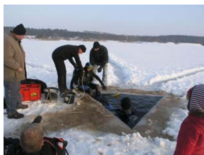
07.Februar - beim Einsteigen