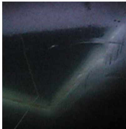
07.Februar - der Einstieg von „unten“