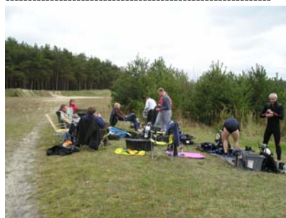
10.April - Vorbereitungen zum Tauchen