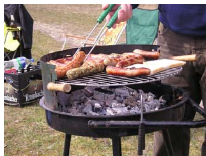
10. April – ohne Worte