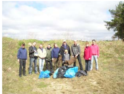
10.April - „Sammlerstücke“