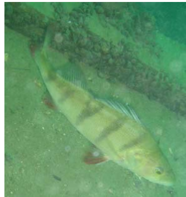
Hemmoor 2007, Oktober, toller Barsch