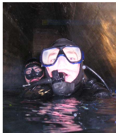
Hemmoor 2007, Oktober, im Bauwerk, ca 25m Tiefe