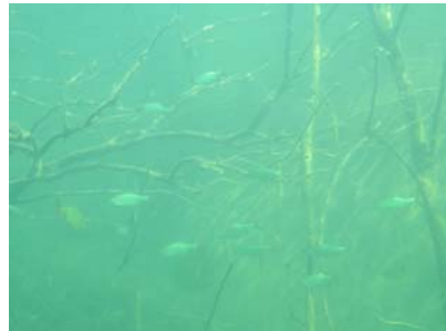
Löbejün – ein Eindruck, aufgenommen am 31.08.2008