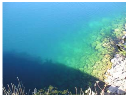
Löbejün – von oben, aufgenommen am 31.08.2008

Löbejün liegt direkt an der A14 von Magdeburg nach Süden, linkerhand, Ausfahrt Nr. 13 (ca. 1h:30min von Stendal)