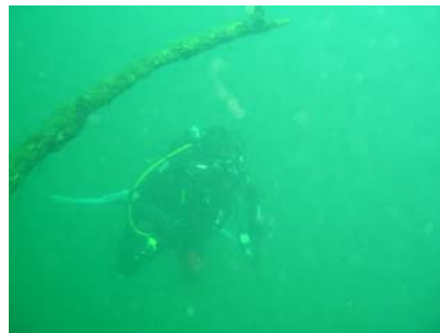
Löbejün – das Wasser, aufgenommen am 31.08.2008