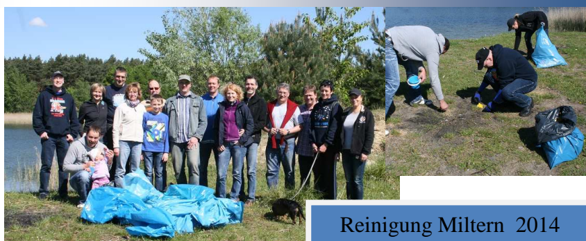
Reinigung Miltern 2014